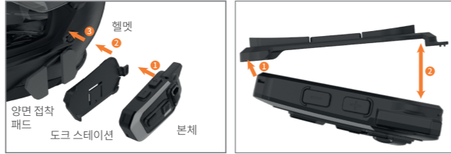
1. 기기 본체를 도크 스테이션에 장착합니다.