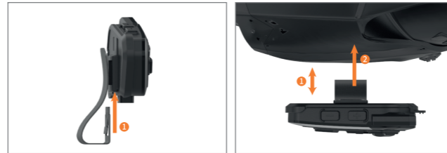
2. 메탈클립의 짧은쪽을 도크 스테이션 하단부에 밀어서 장착합니다.