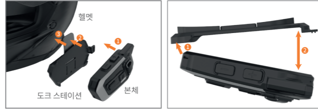
1. 기기 본체를 도크 스테이션에 장착합니다.